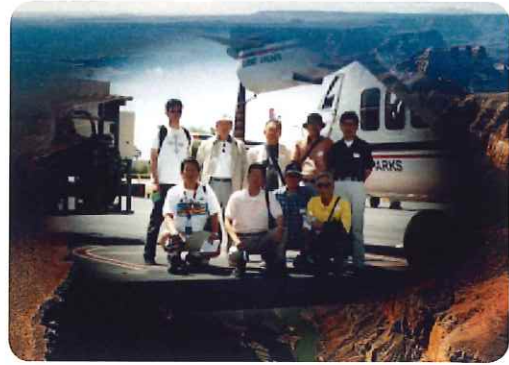
遊覧飛行機に乗る前