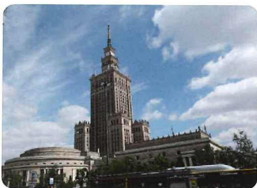
ポーランド文化科学宮殿