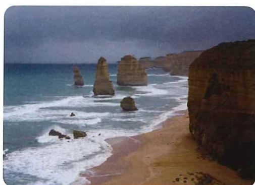
ポートキャンベル国立公園