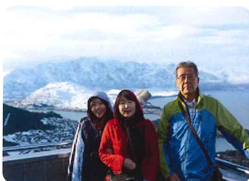
家内と娘を国際大会に連れて行きました