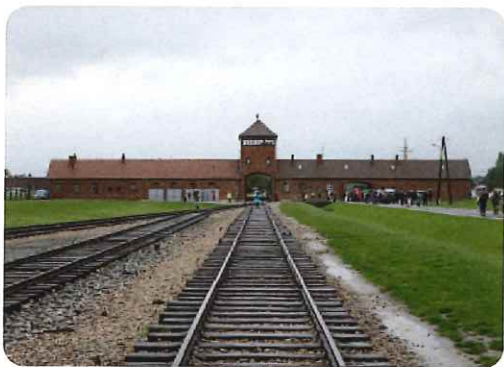
アウシュヴィッツ・ビルケナウ博物館