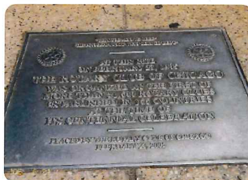
ロータリークラブ発祥の地（プレート）