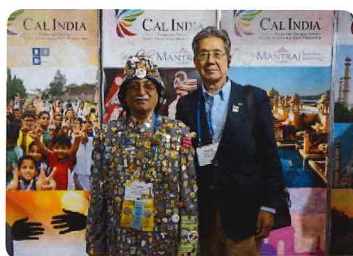
バッジだらけのインド人ロータリアン