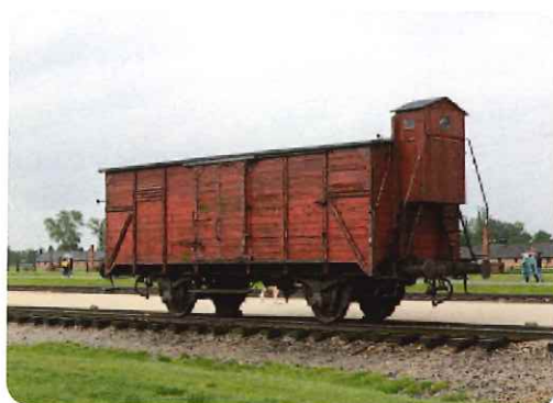
ユダヤ人の囚人を輸送するための古い貨物車