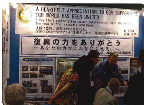
宮城・岩手から「復興の力をありがとう」