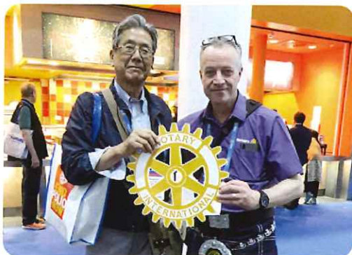
マークで歓迎するロータリアン