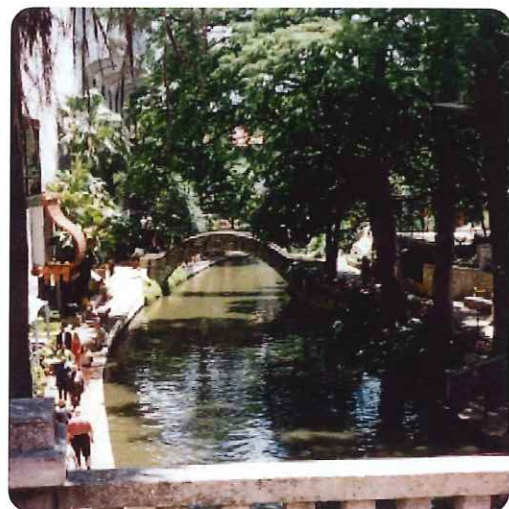
水が綺麗なサンアントニオの運河