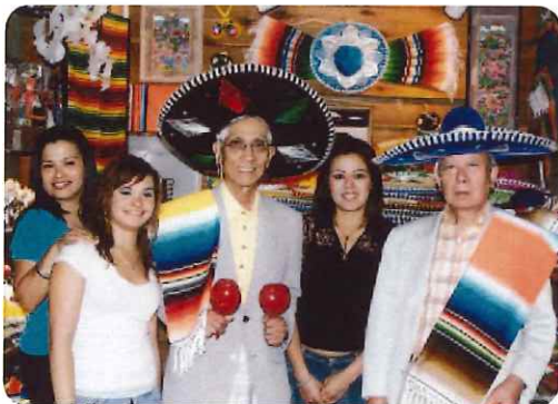
ソムブレロを買いました