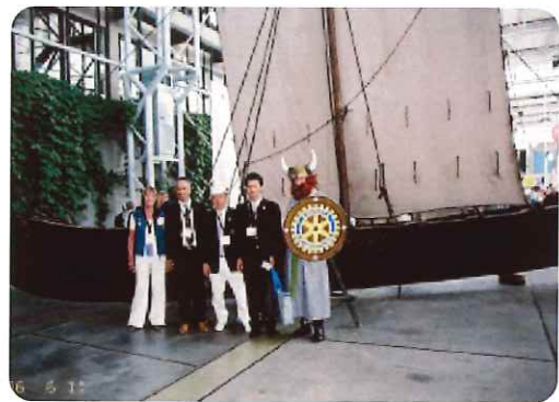
バイキング姿の現地ロータリアン