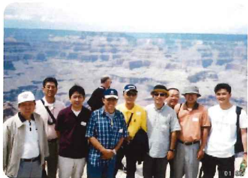
グランドキャニオン