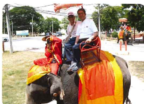
遊覧象に乗るふたり