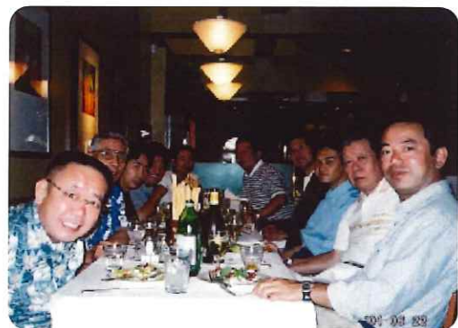
ベネチアンホテルでの晩餐会