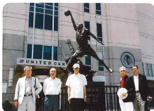
マイケル・ジョーダンの銅像