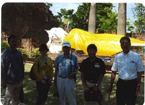
ワット・ポー 大涅槃像