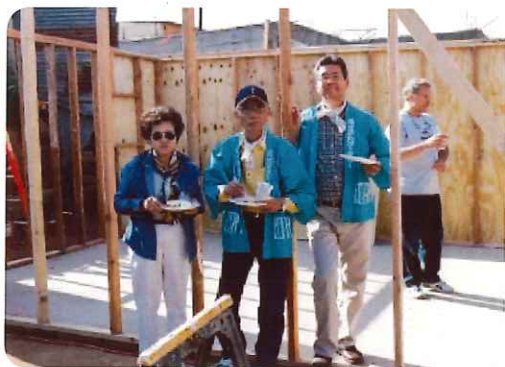
メキシコのティワナで2X4の住居を建築中