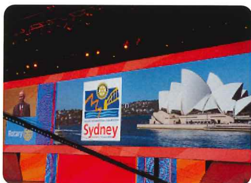
シドニー大会のデザイン