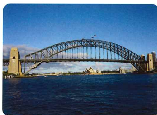
ハーバーブリッジ