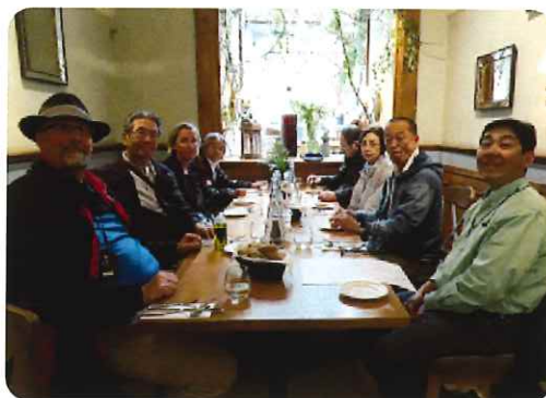
ジャクソン氏（ソルトレイク・パストガバナー）