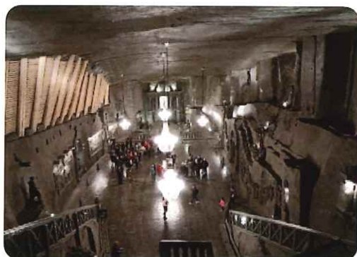
ヴィエリチカ岩塩坑