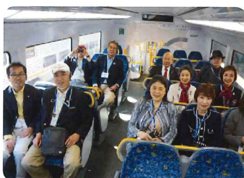
二階建て電車の中で