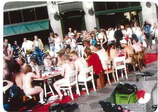
男女ヌードの昼食（公然として日常茶飯事）