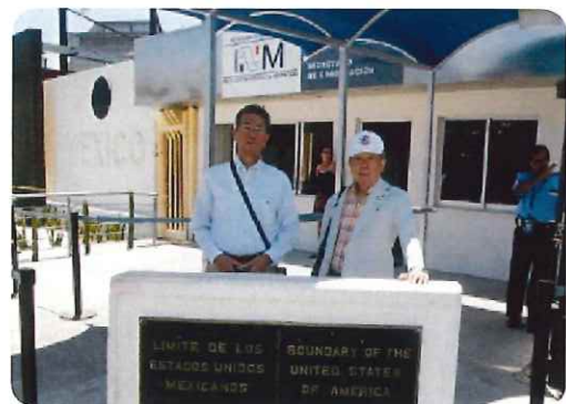
アメリカとメキシコの国境