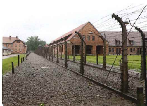
アウシュヴィッツ強制収容所跡