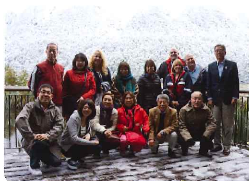
北海道、山形、茨城のロータリアン