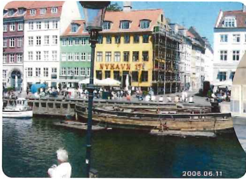
コペンハーゲンの港町