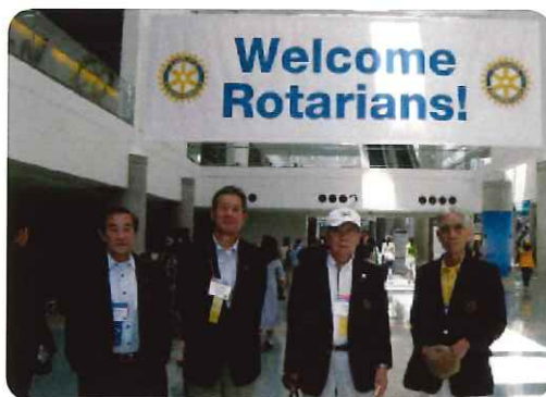
大会式典会場入口