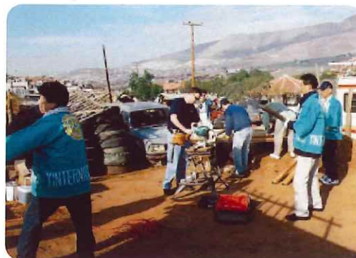
オールド・ミッションRCのメンバーと