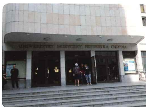
ショパン音楽大学